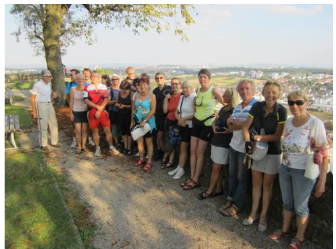
Treffen der Montbéliard-Radler in Ludwigsburg im September 2019