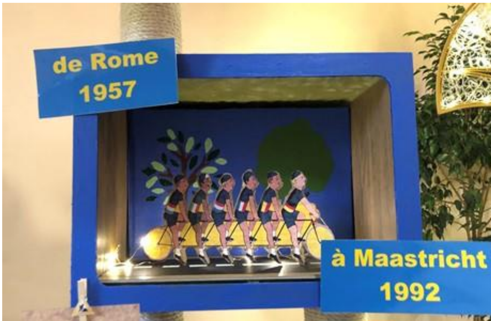
Arbre de la vie - Collège Saint Mainbeuf