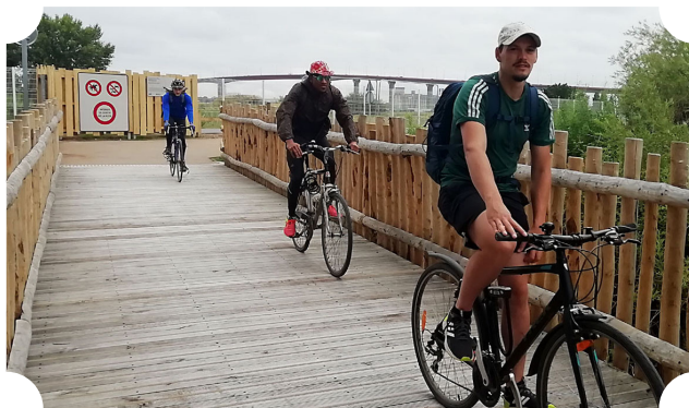
L'ouvrage d'accès au chemin de la Mandine à Bouguenais