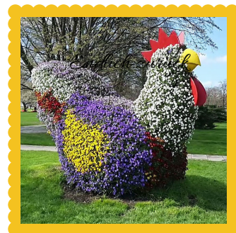
Un coq floral à Erfurt